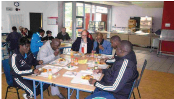
Namibianische Offizielle beim Essen in unserer Cafeteria