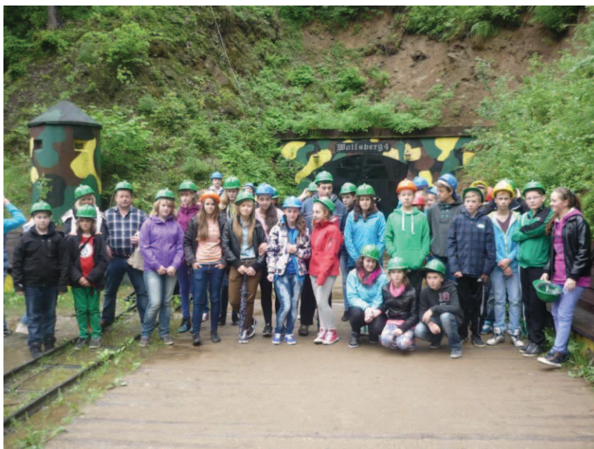
Vor dem Stollen