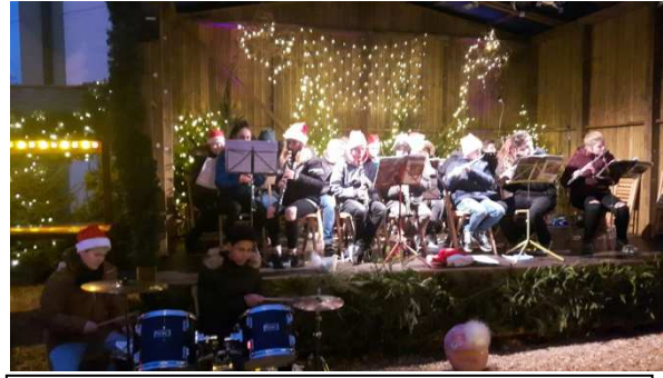
Klasse 7m auf dem Weihnachtsmarkt