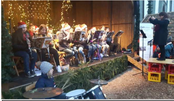
Klasse 6m auf dem Weihnachtsmarkt